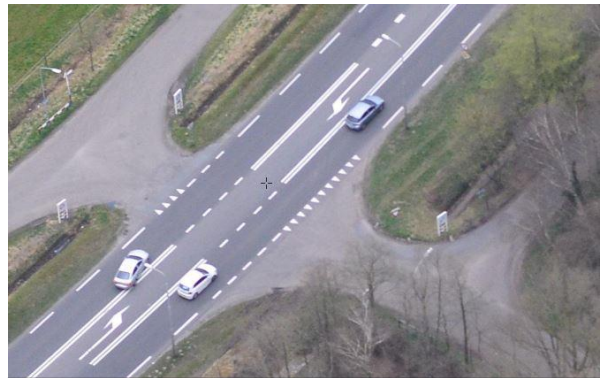
Kruising Grolse Dijk – N18

Het nadrukkelijke streven is om de uitvoering in dezelfde periode op te pakken als de afsluiting van de Zieuwentse kruising, dus in 2021. Waar we bij de afsluiting van de Zieuwentse kruising goed op schema liggen, moet er op het traject Lievelede nog wel veel gebeuren. Ook hier zijn immers veel onderzoeken nodig en moet nog een begin gemaakt worden met herziening van het bestemmingsplan.