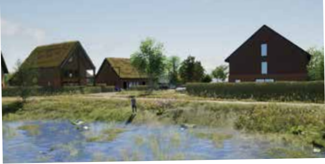
Schets woningen 'Park Vossenburcht'