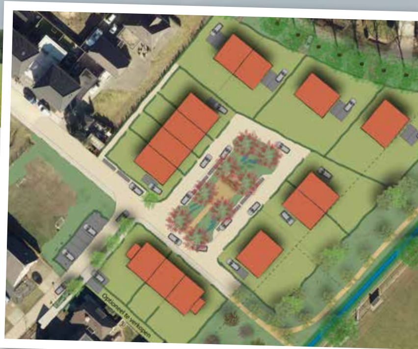
Plan 'Hof aan de Boog'

2. In het voorjaar van 2020 zijn de eerste schetsen van het plan 'Hof aan de boog' aan Mariënelde gepresenteerd. Het gaat om een plan variërend van starterwoningen, seniorenwoningen, 2-kappers tot vrijstaande woningen. In augustus 2020 zijn de kavels in de vooruitgifte gegaan en na vaststelling van het bestemmingplan zijn deze nu alle verkocht/in optie. Om het plan financieel toereikend te houden voor starters is medewerking verleend om een vierkapper nog te wijzigen naar vijfkapper. In totaal gaat het nu om 16 woningen.