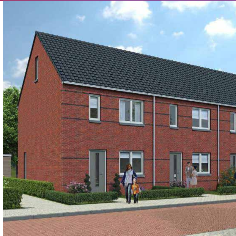
Plan Nieuw Wellink

2 en 3. Met het opgeleverde plan 'Nieuw Wellink', dat ruimte biedt aan 13 wooneenheden voor verschillende doelgroepen, is er een grote inhaalslag gemaakt voor Zwolle. In de toekomst onderzoeken we zeker of de vraag naar woningen zich uitbreidt in het dorp. In dat geval liggen er potentiële kansen met het aangrenzende gebied achter plan Nieuw Wellink.