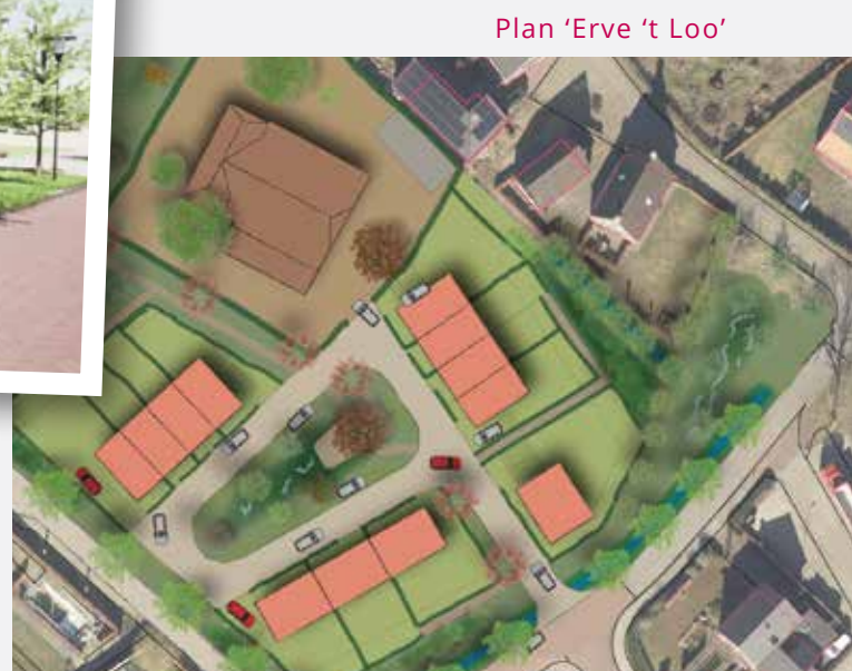
Plan 'Erve 't Loo'