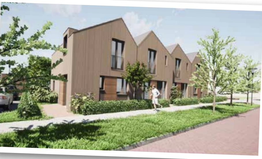
Plan 'erve De Boer'

4. Er zijn nog geen concrete ontwikkelingen met betrekking tot herbestemming van de kerk.