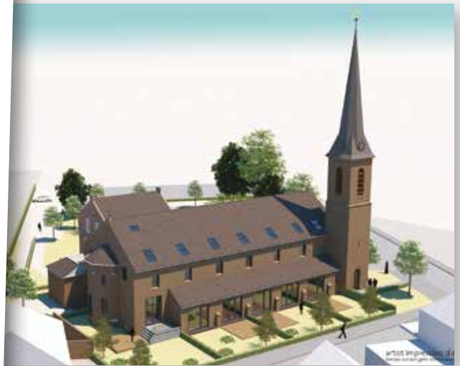
Impressie herbestemming kerk

Na uitvoer van het onderzoek besloot de raad in september alsnog het perceel aan te kopen. De aankoop is inmiddels afgerond en het stedenbouwkundigplan is aangescherpt met Vragenders Belang en de direct omwonenden. De vooronderzoeken zijn inmiddels afgerond en we zijn blij te kunnen melden dat deze maand het college van B&W een beslissing neemt over het bestemmingsplan en dat de verwachting is dat de raad voor de zomer nog beslist over de planvorming. Zodra de raad positief beslist, gaan we direct daarna de kavels uitgeven.