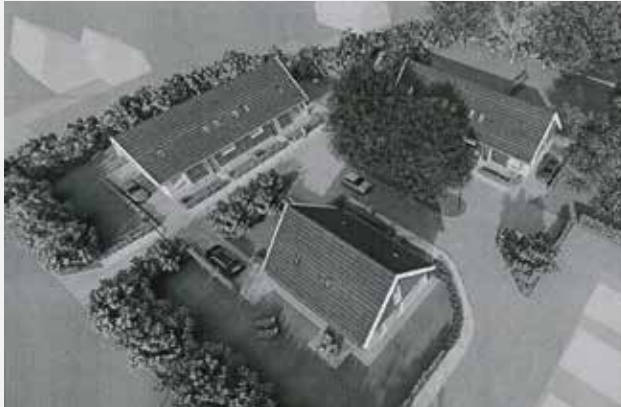
Plan 'Kloezedijk 5'