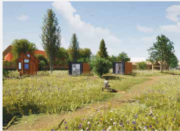
Schets tiny houses in 'Park Vossenburcht'