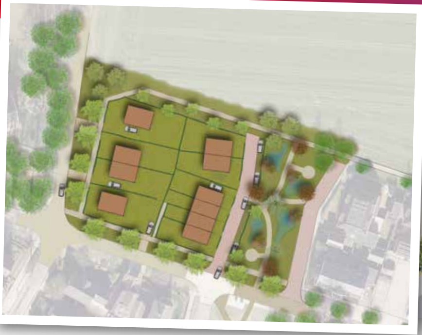
Plan aan de Kapelweg